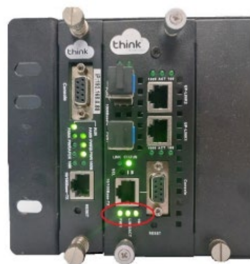
Gerência no cartão