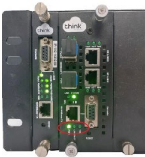
Gerência no módulo